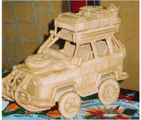
MIVA Auto. Von Kindern im Kongo gebastelt

Tom: Ja, horch was er erzählt: "Bevor mich die Schwestern gerettet haben, schlief ich unter der großen Brücke im Zentrum von Brazzaville. Ich lebte von