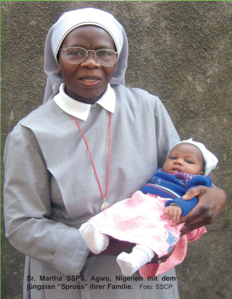
Sr. Martha SSPPS, Agwu, Nigerien mit dem jüngsten "Spross" ihrer Familie.

Herausgeber: St. Petrus-Claver-Sodalität für die kath. Missionen