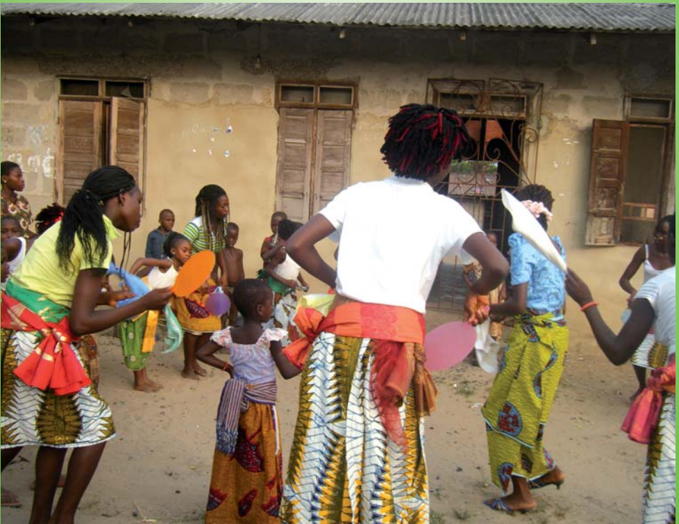
Agwu, Nigerien: Tanzende Kinder

P.b.b. Verlagspostamt 5101 Bergheim b.Sbg. GZ02Z030700 M Erscheinungsort Salzburg Nur zurücksenden, wenn Adressat gestorben oder verzogen Angabe neuer Adresse erbeten Missionshaus "Maria Sorg", 5101 Bergheim bei Salzburg DVR - 0029874 (367)