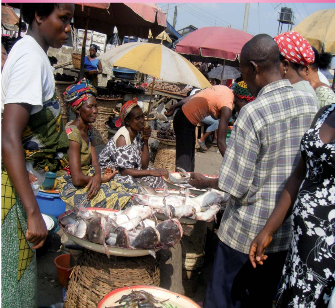
Markt in Nigeria

Herausgeber: St. Petrus-Claver-Sodalität für die kath. Missionen