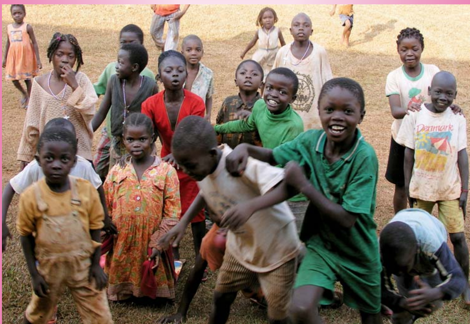
Kinder in Kamerun