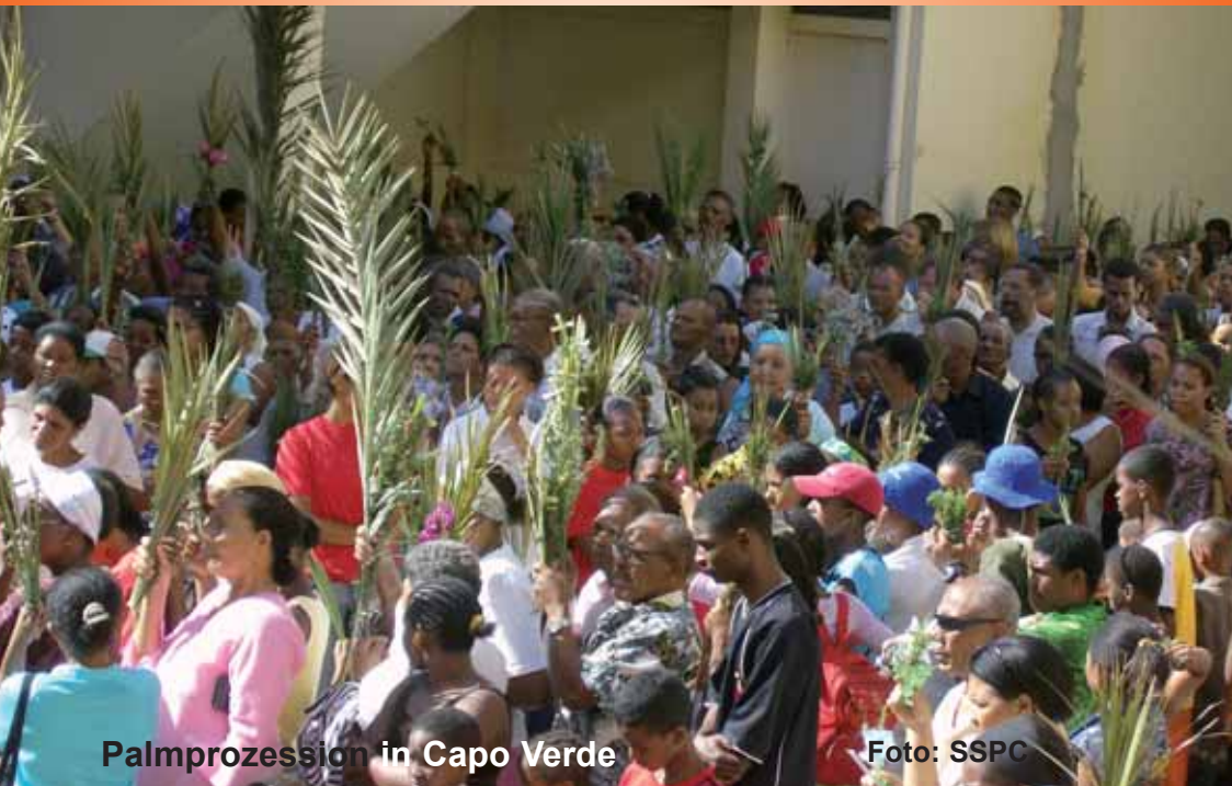
Palmprozession in Capo Verde