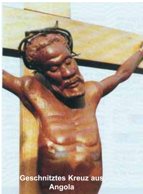
Geschnitztes Kreuz aus Angola

Die Kirche in Afrika erlebt ein außergewöhnliches Wachstum: Zu Beginn des 20. Jahrhunderts machte die Zahl der Katholiken in Afrika nicht einmal zwei Millionen aus und heute sind es 154 Millionen Katholiken in Afrika. Das sind 17 % der afrikanischen Bevölkerung. Es gibt viele Berufungen zum Priestertum und zum geweihten Leben. Das „Missionsland“ Afrika entsendet bereits selbst viele Missionare, sowohl für den eigenen Kontinent als auch für die ganze Welt.