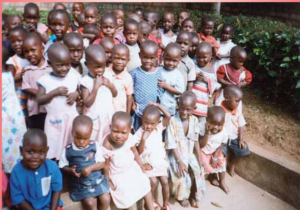
Kinder in Masaka, Uganda

P.b.b. Verlagspostamt 5101 Bergheim b.Sbg. GZ02Z030700 M Erscheinungsort Salzburg Nur zurücksenden, wenn Adressat gestorben oder verzogen Angabe neuer Adresse erbeten Missionshaus "Maria Sorg", 5101 Bergheim bei Salzburg DVR - 0029874 (367)