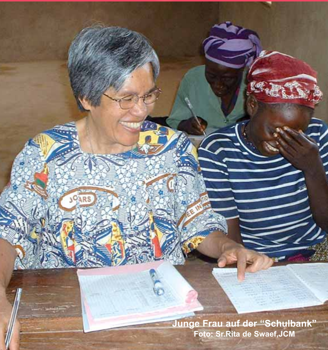
Junge Frau auf der "Schulbank"

Herausgeber: St. Petrus-Claver-Sodalität für die kath. Missionen