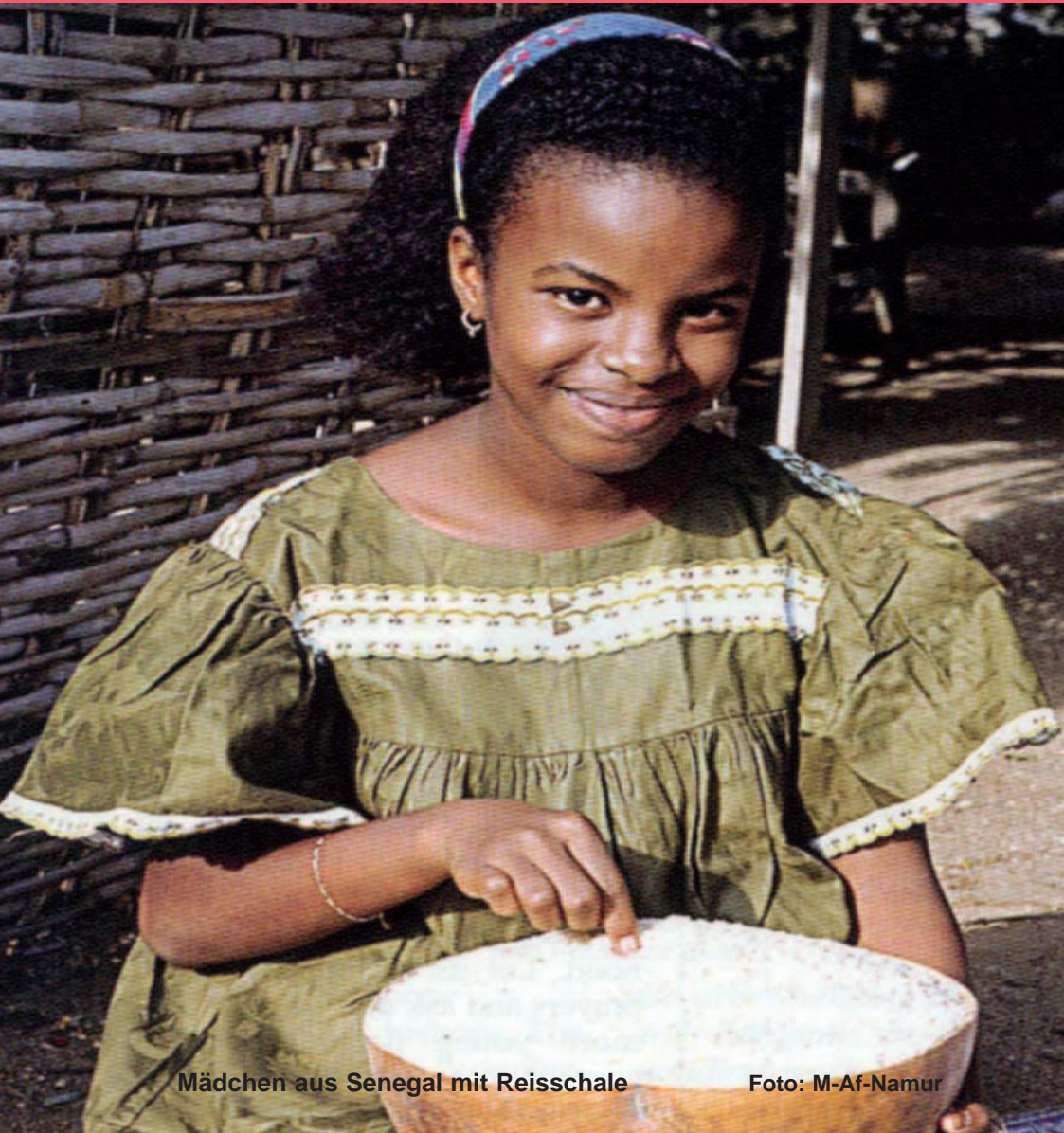
Mädchen aus Senegal mit Reisschale

Herausgeber: St. Petrus-Claver-Sodalität für die kath. Missionen