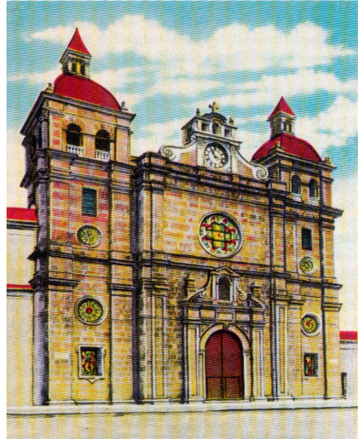
»Petrus Claver Kirche« in Cartagena

Vielleicht im Gedenken an seinen geistlichen Lehrmeister Br. Alfons, bat Petrus Claver den Pater Provinzial Gonzalo de Lyra ihn im Stand des