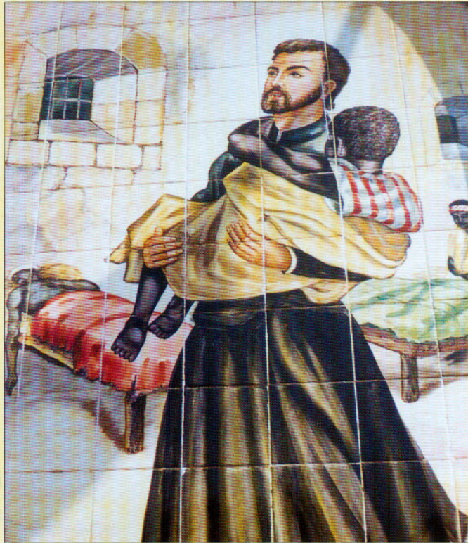
HL. PETRUS CLAVER »Sklave der Sklaven«