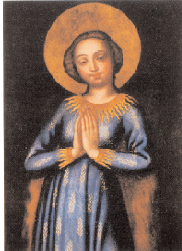
Ährenmadonna in der Gartenkapelle von Maria Sorg

So ist es nicht verwunderlich, dass sie die besondere Verehrung des Heiligen Geistes auch für ihre Schwestern in die Konstitutionen der Kongregation aufnahm ebenso wie die Verehrung für das Heiligste Herz Jesu, aus dem ihre Schwestern "eine brennende Liebe zum Nächsten und einen lebendigen übernatürlichen Eifer für die Ausbreitung des Gottesreiches" schöpfen sollten.